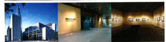
東京国際フォーラム外観 美術館入口 展示室