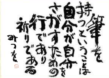
「筆を持つということは」1970年頃