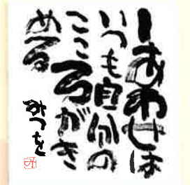
「しあわせはいつも」1980年代前半